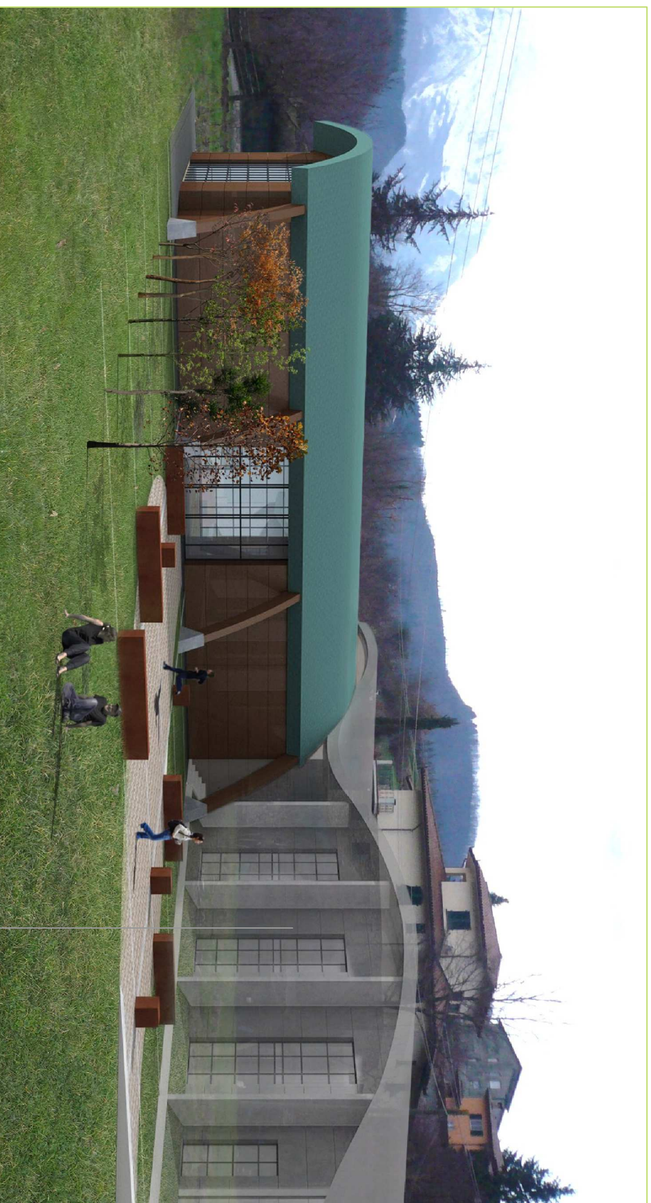
NUOVA SCUOLA MEDIA