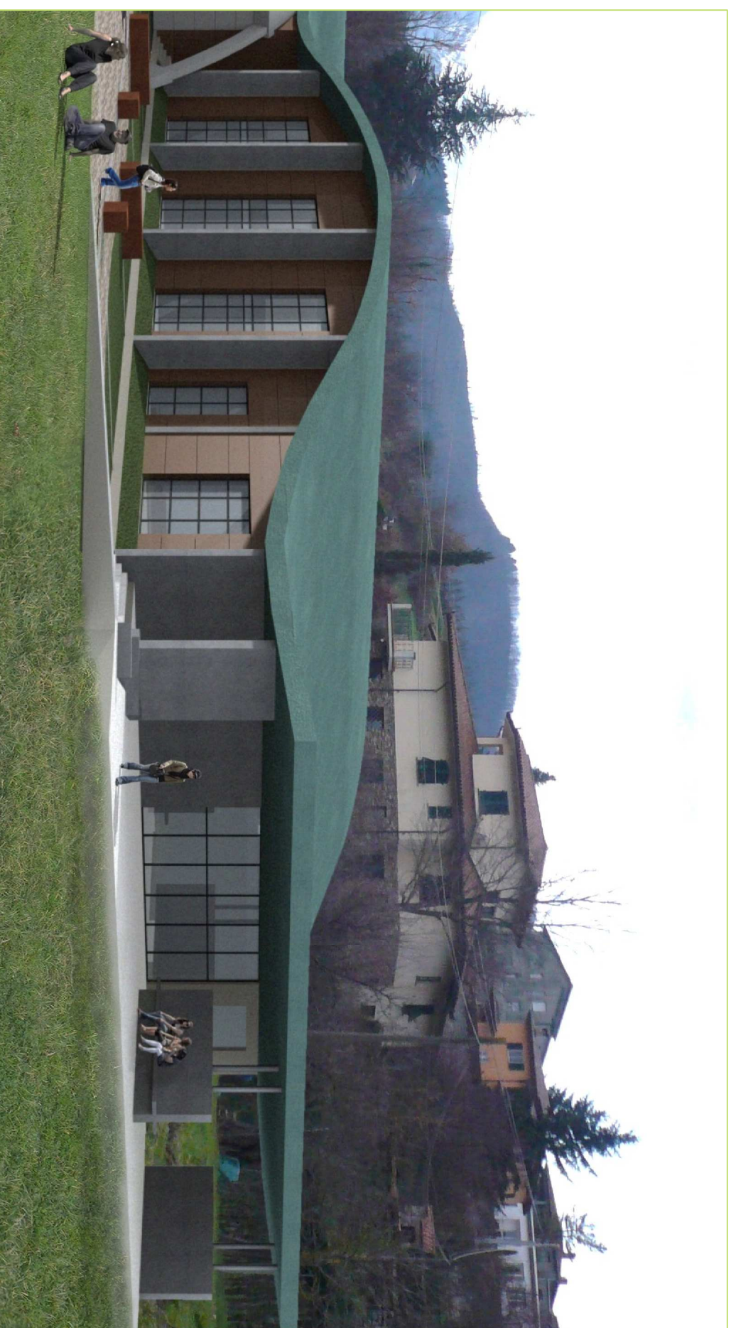
NUOVA SCUOLA MEDIA