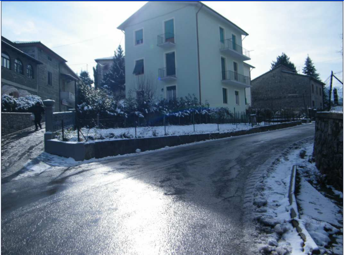
AREA DI PARCHEGGIO B