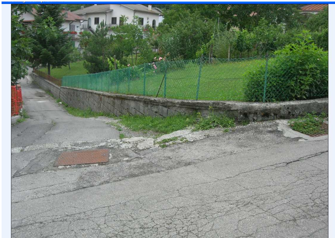
AREA DI PARCHEGGIO A