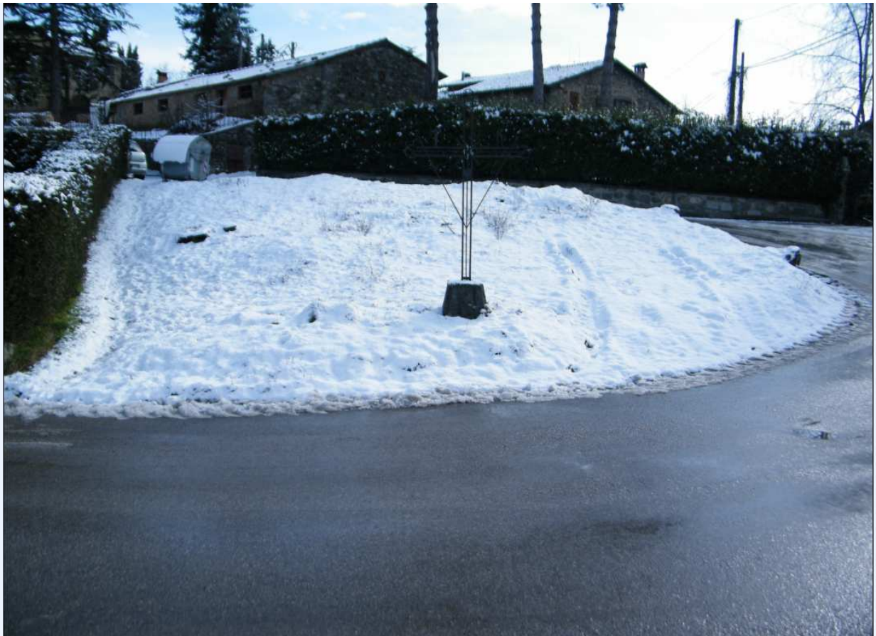
AREA DI PARCHEGGIO C